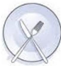
Bitte legen Sie nach