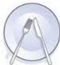
Ich mache eine Pause

Nein, auf keinen Fall. Tatsächlich ist Schweigen unhöflich, vor allem bei Geschäftsessen oder Hochzeiten. Der Trick ist, tatsächlich nur so kleine Bissen zu nehmen, dass man sprechen kann. Am besten die Gabel oder den Löffel immer nur halb füllen.