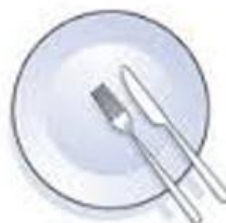
Sie dürfen abräumen